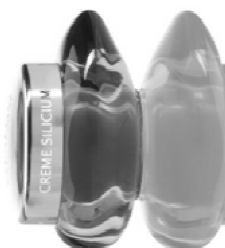
VT 1930 – Pot-galet 50 ml KT 1930 – Tube 150 ml

A domicile : appliquer matin et soir, sur l'ensemble du visage et du cou. Associer-la plusieurs fois par an au Concentré Silicium ou aux Extraits Silicium Ovale et Cou. En cabine : lors du Soin Silicium Lift (cf fiche technique du soin).