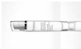
VT 1905 – Flacon-pompe 30 ml KT 1901 – Dans le coffret « Programme Collagène Marin »

A domicile : appliquer matin et soir, avant la Crème Collagène ou la Crème Hyaluronique en effleurages légers sur le visage et le cou. A utiliser en cure intensive d'un mois et à renouveler plusieurs fois par an. En cabine : Lors du Soin Lisseur Collagène, tubes unidoses 3ml (pour réaliser le modelage Dermastim) dans le Coffret Programme Collagène Marin